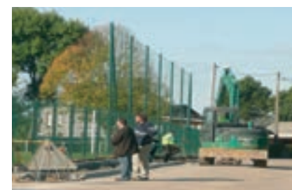
SAINT-CLAIR-SUR-LES-MONTS : 8 candélabres avec lanternes sodium seront posés après un effacement intégral. Coût de travaux : 92 937 € TTC dont 71 671 € financés par le SDE et le DOF.