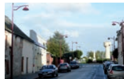
FAUVILLE-EN-CAUX : pose de 8 candélabres pour éclairer la bd Alleaume entre la mairie et l'Espace Lecoutre. Coût de travaux : 44 665 € TTC dont 12 290 € financés par le SDE.