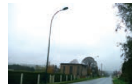
HARCENVILLE : effacement intégral des réseaux près de la voie ferrée avec 29 candélabres posés. Coût de travaux : 300 631 € TTC dont 169 632 € financés par le SDE et le DOF.

DOF : syndicat mixte d'électrification rurale et de gaz de la région de Doudeville-Ourville-Fauville.