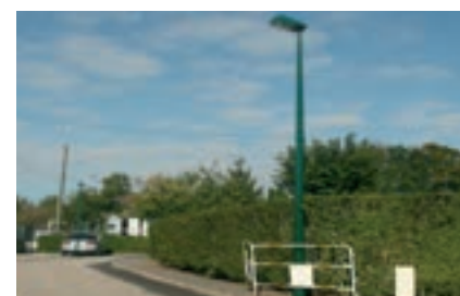
AUTRETOT : enfouissement complet des réseaux et pose de 22 candélabres sur plusieurs voies communales. Coût des travaux : 321 496 € TTC dont 220 666 € financés par le SDE et le DOF.